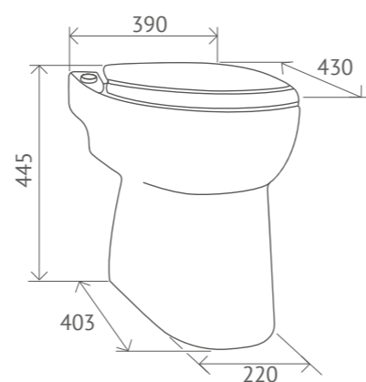
Altura de evacuação (m)