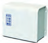
Bloco eletrónico deportado